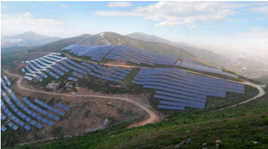
微孔灌注桩工程实景